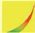
（二）第 2 個圖像