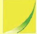
（三）第 3 個圖像