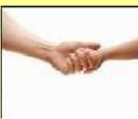
（四）第 4 個圖像