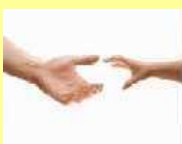
（一）第 1 個圖像