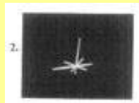
（二）第 2 個圖像