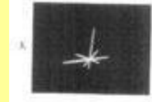
（三）第 3 個圖像