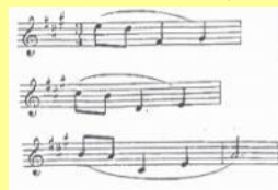
（五）第 5 個圖像

五、商標描述及樣本（詳細說明個別靜止圖像的排列順序及變化過程，如包含聲音及不屬於動態商標之虛線部分者，應一併說明，並應檢送圖像變化之 AVI 或 MPEG 檔光碟片）