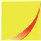
（一）第 1 個圖像