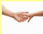
（二）第 2 個圖像