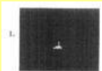
（一）第 1 個圖像