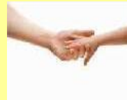
（三）第 3 個圖像